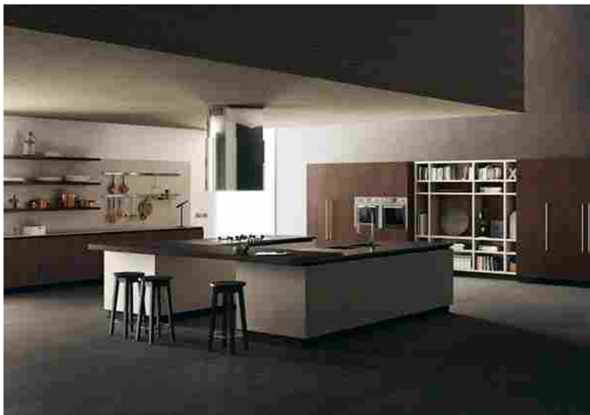
Un'area del nuovo showroom Scavolini

Opening in Campania per Scavolini , che ha inaugurato un nuovo store monomarca in provincia di Caserta. Situato a Maddaloni , lo showroom ha una superficie di oltre 366 metri quadri, interamente dedicata alle collezioni cucina, bagno e living dell'azienda.